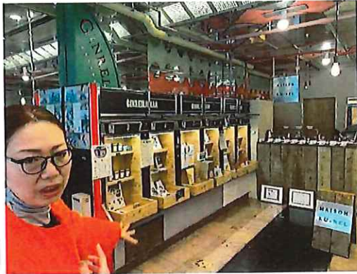
^2 パチンコ台の場所を商品棚等に改装