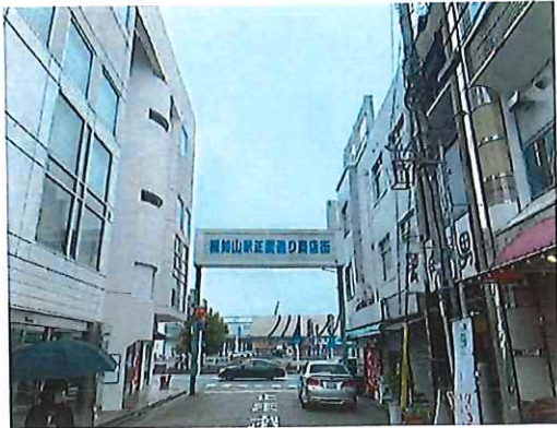
^9 銀鈴ビル(写真右)より南、駅方向を望む