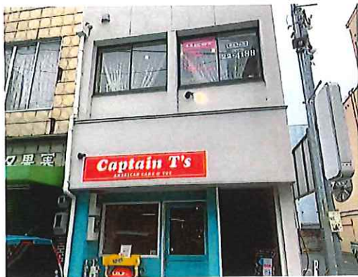
^11 ケーキ店とエステネイルサロン(フロントのサブリース事業による出店)