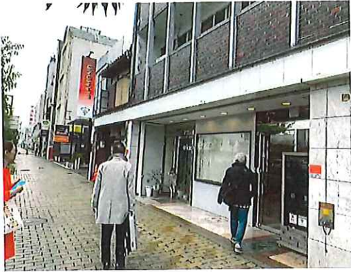
^5 けやき通り(4車線道路)側外観、1階美容室