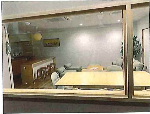
^6 レンタルスペース(レンタルリビング)