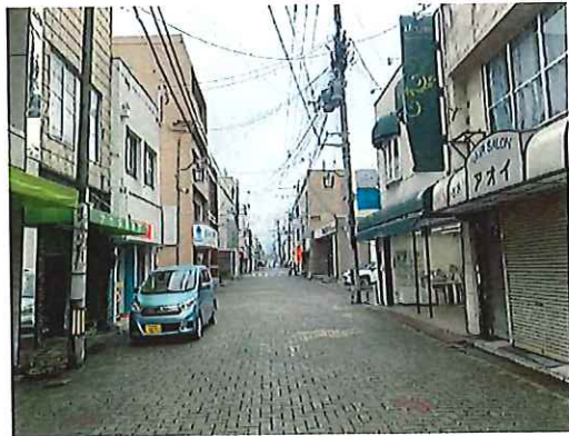
^10 銀鈴ビルより北を望む