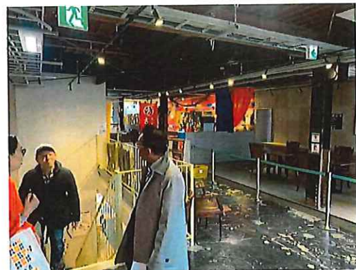
^4 ビル2階フードコート風店舗の並び