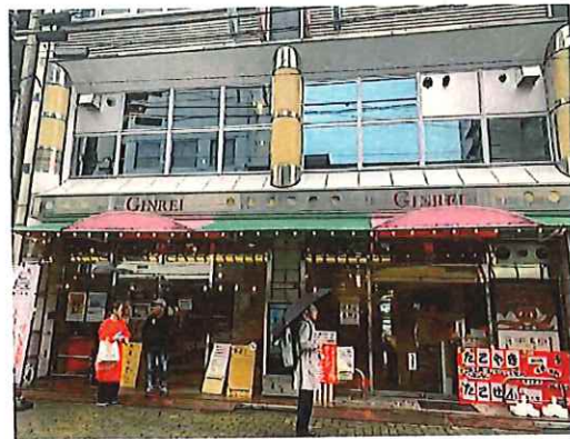
^8 商店街側外観(東西の通りに面した造り)