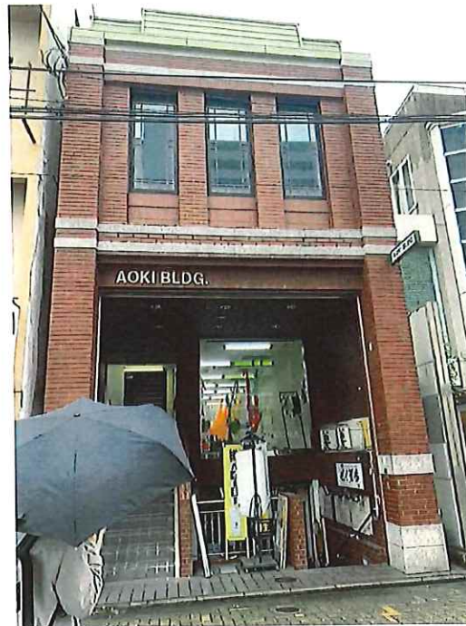
^12 下から居酒屋、ヨガスタジオ、フォトスタジオ(ビルタイプの店舗、フロント所有)