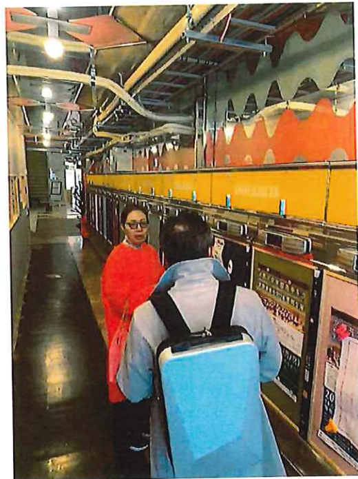
^1 ビル1階通り抜け通路、内観を一部そのまま使用