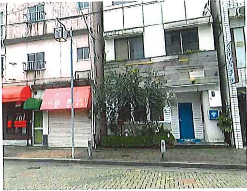
^15 ゲストハウス(写真右、元旅館、サブリース事業による出店)