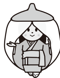
湯沢市観光PRキャラクター こまちちゃん

●ご本人様のご病気・長期不在などで回答できない場合は、代理の方が記入してください。