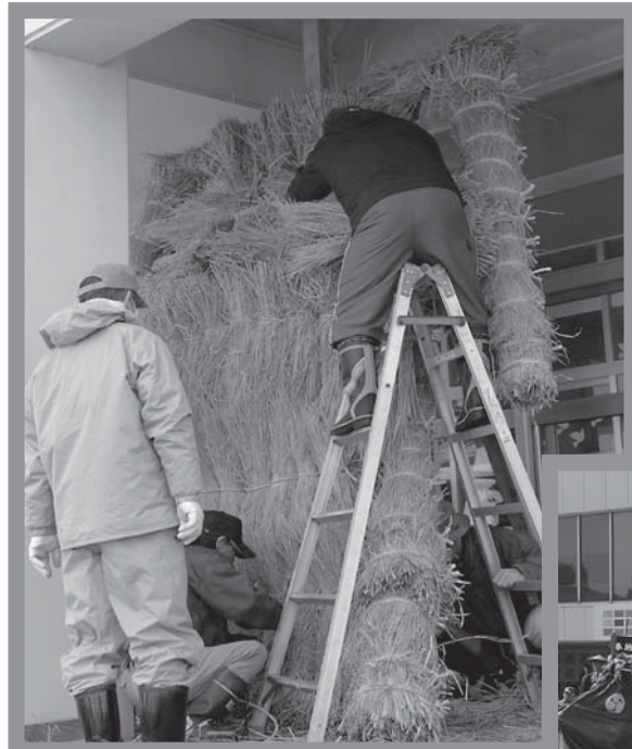
▲3月3日、末広町の皆さんが、鹿島様の出発前に、入念な仮組み作業を行いました

これは、毎年、旧暦の2月15日にご先祖さまを供養するために行われているもので、念仏の内容により五回に分けられ、太鼓の音に合わせて念仏を唱えながら十回ずつ数珠を回していました。