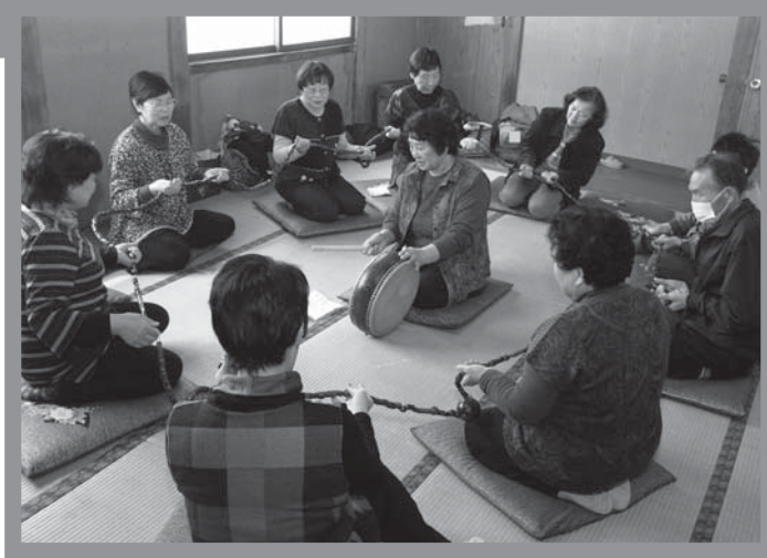
▼念仏を唱えながら数珠を回している様子

明治16年からの記録が残るこの行事。この日は、子どもからお年寄りまで約40人が参加。打ち鉦に合わせ念仏を唱えながら約30メートルの数珠を回し、無病息災や交通安全などを祈りました。