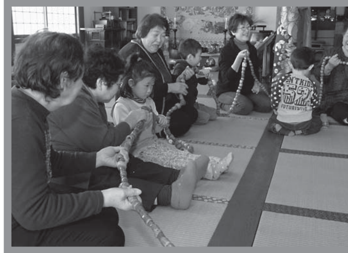
▲子どもからお年寄りまで幅広い年代の住民が参加