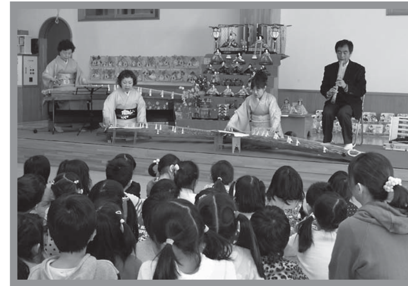
▲子どもたちは、「さくら」など知っている曲を演奏に合わせて口ずさんでいました