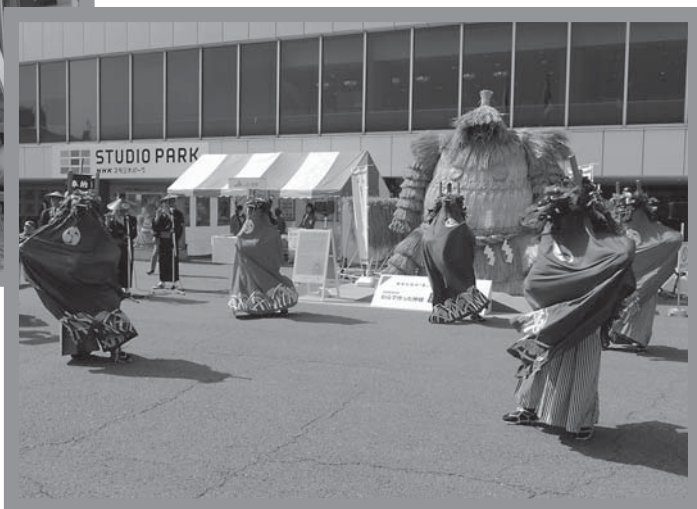
展示された鹿島様の前で、関口作佐楽舞を披露

期間中は、鹿島様と記念写真を撮る家族連れなどが見られたほか、鹿島様の前では三関地区の関口作佐楽舞も披露され、訪れた多くの人を楽しませました。