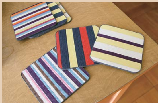
今回の「学校展」で展示・販売する生徒の製作品。コースターやアームカバー、髪留めのほか、ビーズで作ったブレスレットや陶器のボウルなど、子どもたちが取り組んだ学習の成果を、ぜひ会場でご覧ください。