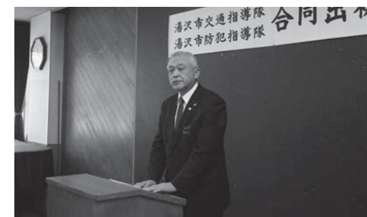
▲1月6日、湯沢市交通指導隊・防犯指導隊合同出初式にて