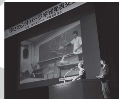
▽湯沢翔北高等学校3年D組

【熱い街ゆざわ from ジオパーク】と題し、昨年、ふるさとCM大賞に出品した、ジオパークを題材とした湯沢市のコマーシャル制作への取り組みを発表