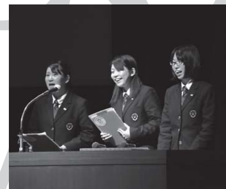
▽湯沢翔北高等学校商業クラブ

【地域を熱く沸かす「地熱のまち・ゆざわ」プロジェクト】と題し、地熱を使った新たな特産物を産・学・官の連携で開発しようと進めている取り組みを発表