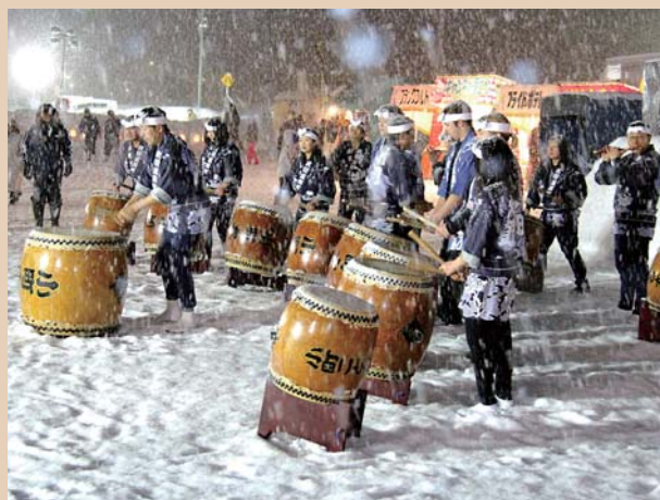
初舞台は雪の降りしきるあいにくの天候でした(写真上)。2月15日に行われたかだる雪まつり(写真左)も降りしきる雪で、管理棟の軒下に演奏場所を変更。雪の降る中でも、飛び入りの子どもたちと一緒に演奏を楽しみました。