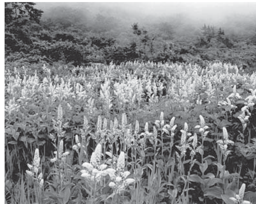
▲最優秀賞「コバイケイソウ群生」