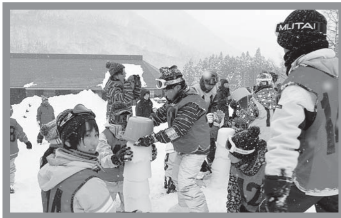
▲バケツで作製した雪の塊を積み上げて、塔の高さを競いました