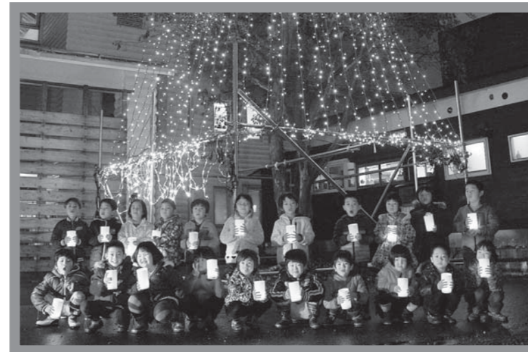
▲ライトアップされた木の前でキャンドルを持って記念撮影