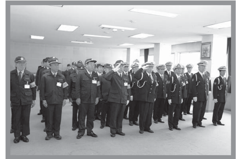
▲新年に士気を高め整列した隊員の皆さん

その後、交通安全指導隊長から「飲酒運転撲滅と交通死亡事故ゼロを目指し、交通安全運動に積極的に取り組む」、防犯指導隊長からは「犯罪のない安全安心なまちづくりのため、パトロールなどの防犯活動に取り組む」と、力強い新年の決意表明がありました。