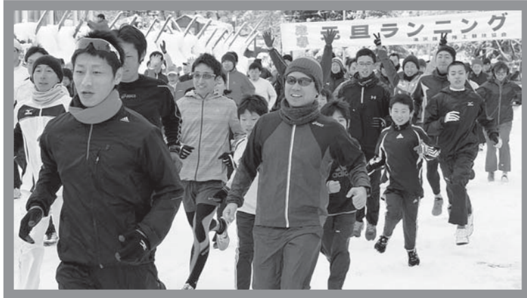
▲号砲を合図に勢いよく走り始める参加者