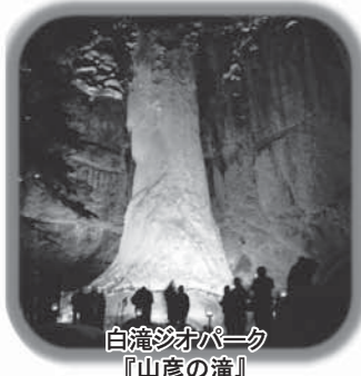
白滝ジオパーク 『山彦の滝』