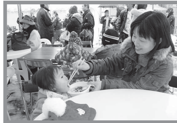
▲年明けうどんを楽しむ親子もたくさん見られました