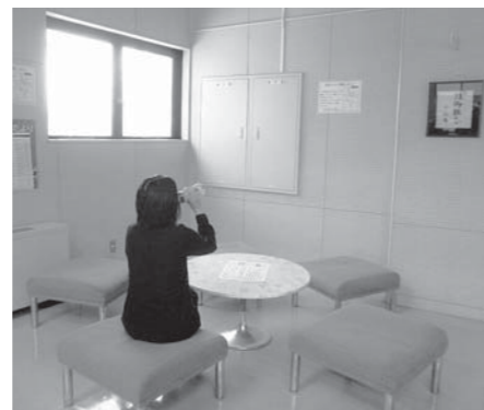
▲湯沢図書館2階 飲食コーナー

市内の4施設ごとに飲食できる場所が違いますので、ご利用の際は各施設に確認をお願いします。