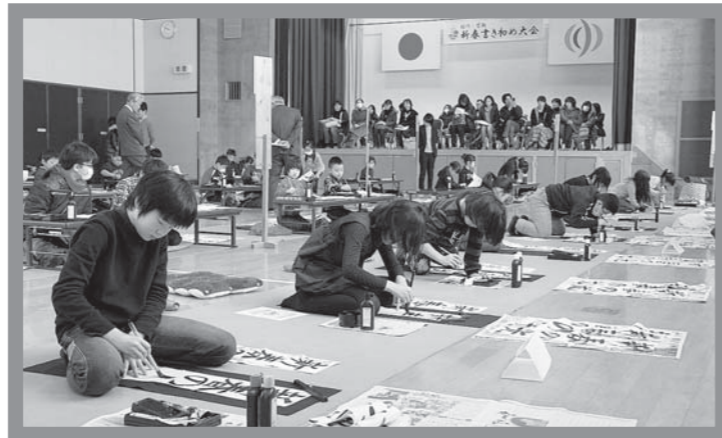
▲お題を思い思いに伸び伸びと書いていました

当日は、稲川・皆瀬地域の小・中学生55人が参加し、半紙の部と条幅の部に分かれて、「たこ」、「ひかり」、「天空」、「生きる力」、「出発」、「新春の光」、「実現」、「理想実現」の新年にちなんだお題を一筆一筆丁寧に書き初めをしていました。