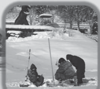
三笠ジオパーク 『桂沢エリア』