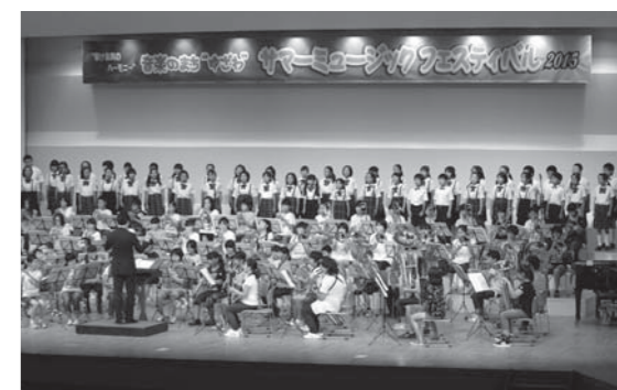
▲フェスティバルジュニアキッズ