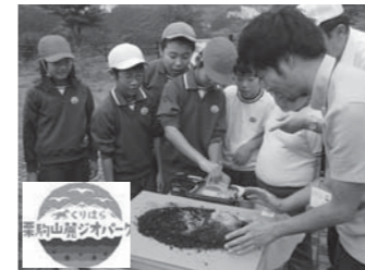
栗駒山麓ジオパーク(特別出演)