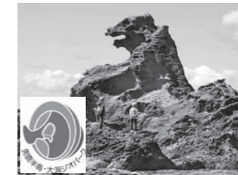
男鹿半島・大湯ジオパーク