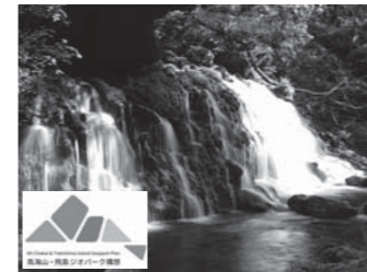
鳥海山・飛島ジオパーク構想