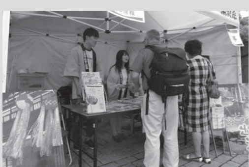
来場者への会場案内

参加者は、会場案内や着ぐるみでのPRのほか、来場者や市内からの出展者と交流を深めました。