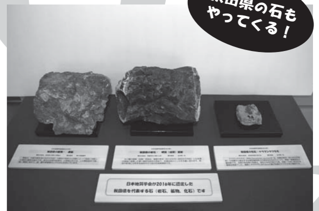
珍しい岩石や化石を展示