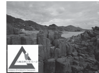
八峰白神ジオパーク