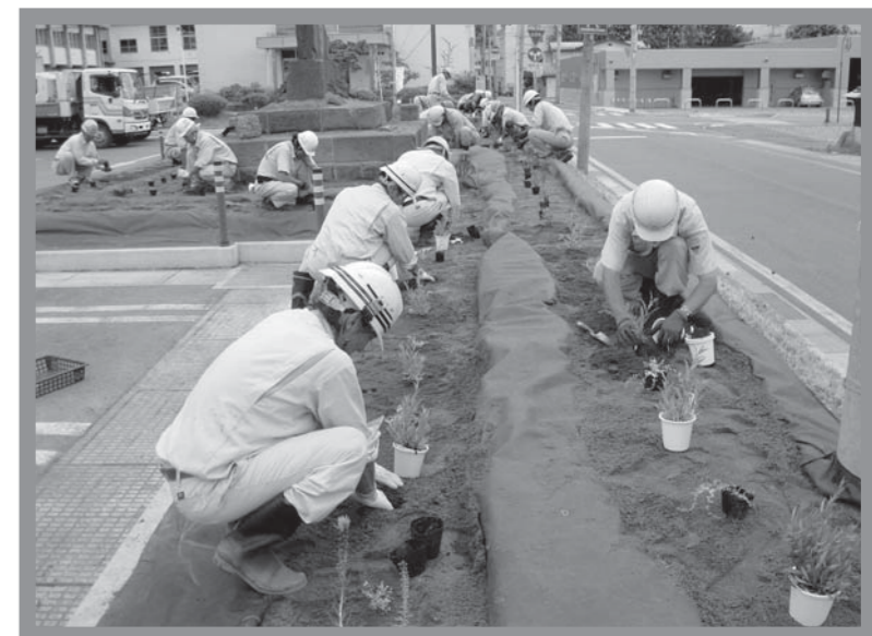
▲宿根草の花苗を植栽する作業員の皆さん

作業員約30人の手により、土壌改良材と砂などを混ぜた土を入れ替え、防草シートを張った後、ゲラニウムなど8種類の宿根草約250本が植えられて、西側の緑地帯が綺麗に整備されました。