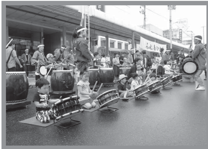
▲和太鼓に挑戦する子どもたち