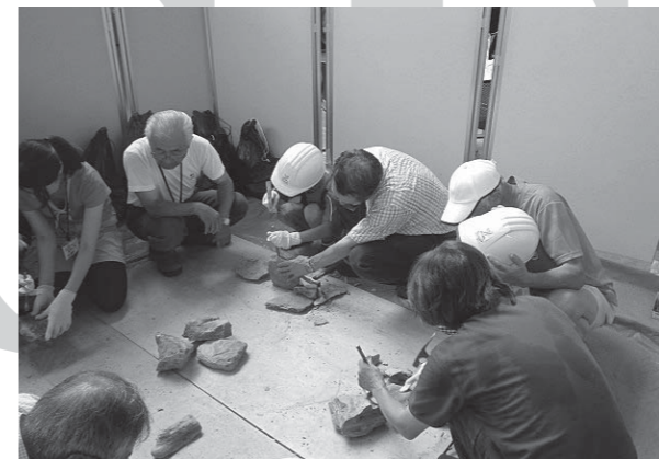
石を割って化石を見つけよう