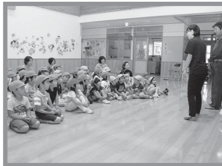
▲真剣に話を聞いている園児たち

柳町商店街を歩行者天国にし、身体障がい者疑似体験や餅つき、太鼓の演奏など多くのイベントが行われました。来場者は、会場に設置された「ふ・れ・あ・い」の4文字を集めるスタンプラリーに参加したり、子どもが和太鼓に挑戦するなど、多くの家族連れでにぎわっていました。