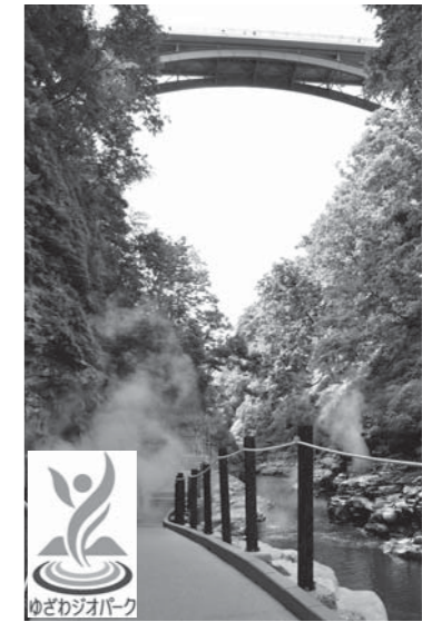
ゆざわジオパーク