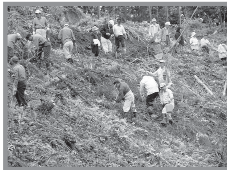
▲桜とモミジの苗木を植える参加者