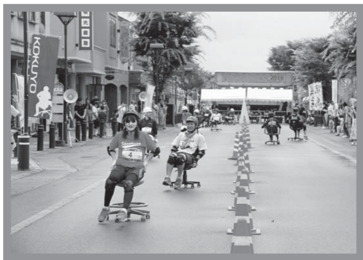
▲懸命に足でいすを進める選手たち

午後からは、同商店街特設周回コースにおいて、県内外から12チームがエントリーし「事務用いす」での2時間耐久レース（いす-1グランプリ）が行われました。1チーム3人が交代しながら周回数を競い合う白熱したレースに、沿道からは熱い声援が送られていました。