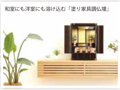
和室にも洋室にも溶け込む「塗り家具調仏壇」

仏壇・仏具の製造・販売、卸売業 〒012-0106 湯沢市三梨町字間明田132 TEL: 0183-42-5050 URL: http://www.kanedai-butudan.co.jp