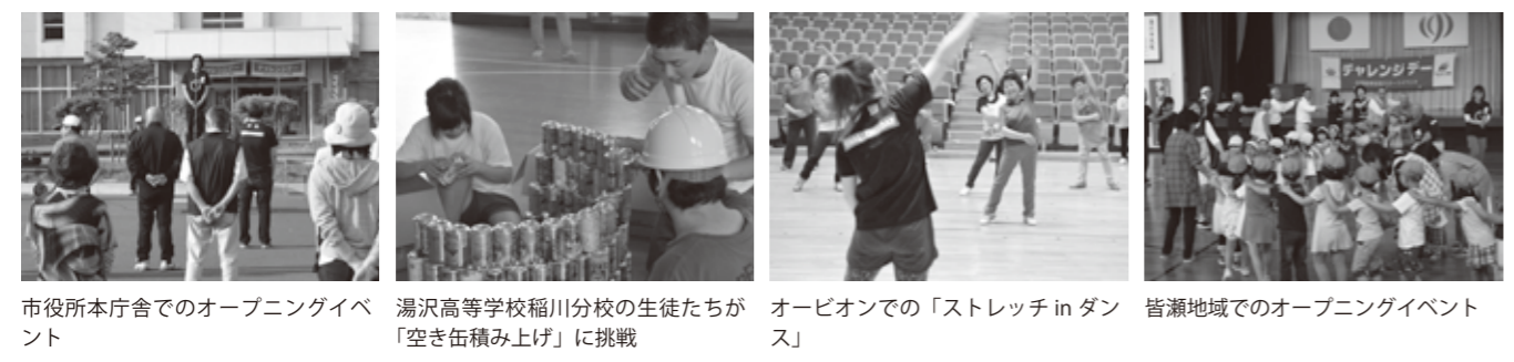
市役所本庁舎でのオープニングイベント 湯沢高等学校稲川分校の生徒たちが「空き缶積み上げ」に挑戦 オーピオンでの「ストレッチ in ダンス」 皆瀬地域でのオープニングイベント