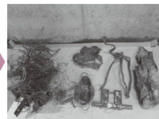
▲炉を停止しないと取り除けない場合も...