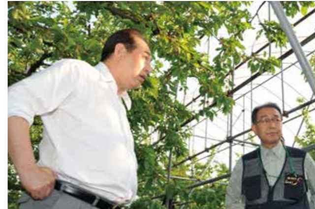
▲三関地区を視察する御法川信英衆議院議員と鈴木市長

みのりかわのぶひで 御法川信英衆議院議員、むらおかとしひで 村岡敏英衆議院議員が、5月15日の降ひょう被害状況の視察のため、被害にあった地区を訪れました