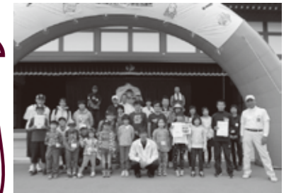
昨年のジオパークGO！の様子。昨年は親子向けに行いました