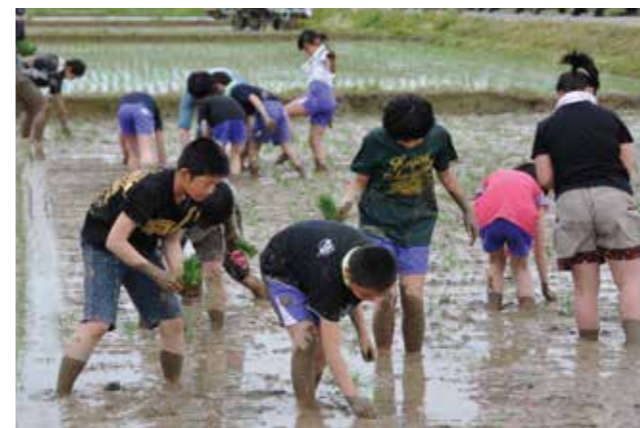
▲三梨小学校の田植え体験学習