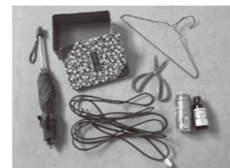
▲もえるごみの中に混じっていた不燃物