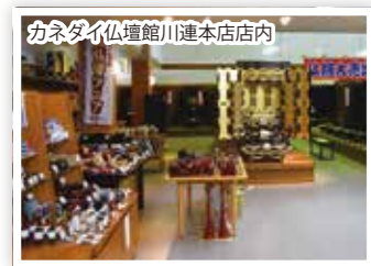
株式会社 カネダイ

6月24日から8月12日まで、「カネダイ仏壇館」全店で「お盆大感謝祭」を開催していますので、私たちの提案する、現代のライフスタイルに合わせたデザインと伝統の確かな技をぜひご覧ください。また、11月には京都で仏壇