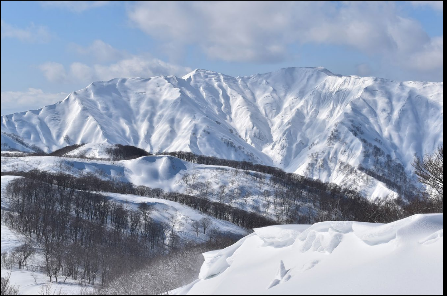
「厳冬の神室山／ いさざわ 軍沢岳から」 投稿者：カムラー