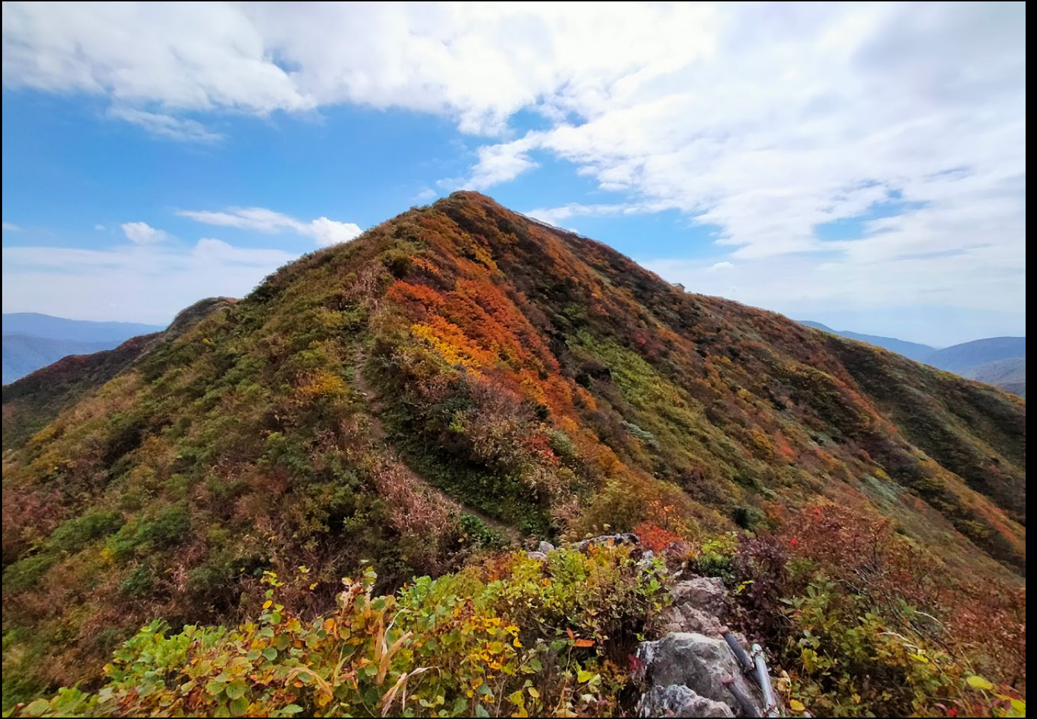
「色づく山頂／神室山」 投稿者：カムラー