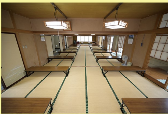
教養娯楽室、集会室1・2