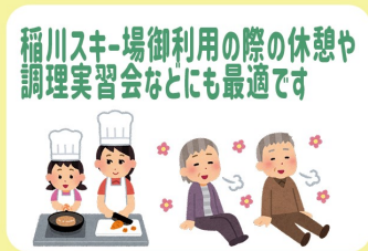
稲川スキー場御利用の際の休憩や調理実習会などにも最適です