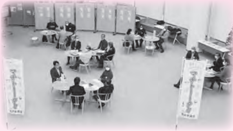
コーヒーを飲みながらリラックスした雰囲気 会話が弾みます