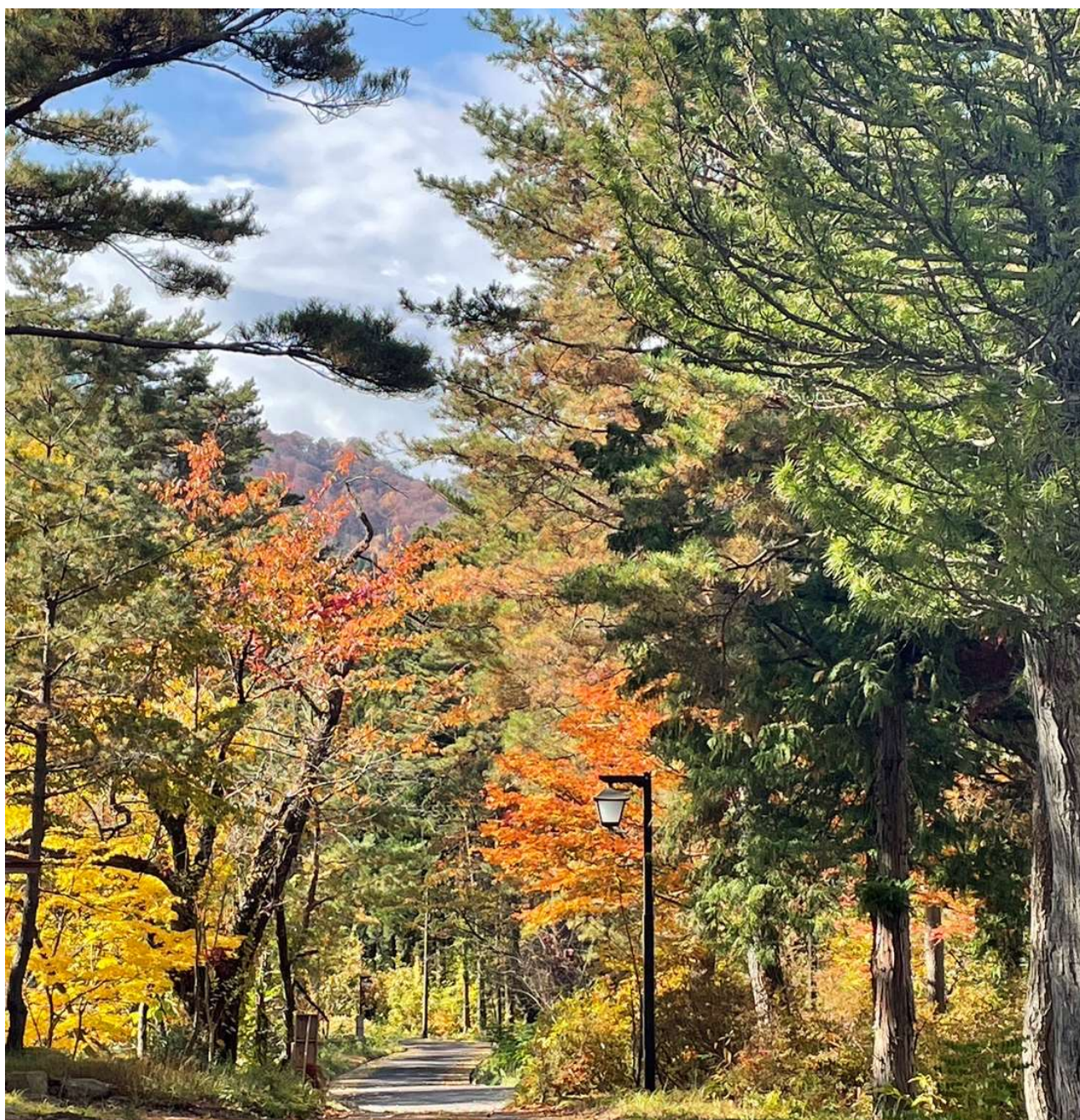
湯ノ又大滝へ続く道