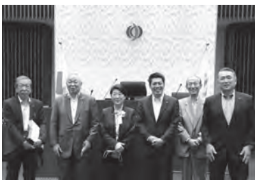
加賀市議会 総務経済委員会の皆さん

5月17日午前、石川県加賀市の総務経済委員6名・議会事務局随員2名の計8名が本市を行政視察のため来庁されました。「地球温暖化対策実行計画(事務事業編)について」「地熱開発について」をテーマに市の担当部局から説明があった後、活発な意見交換が行われました。