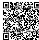
乳幼児突然死症候群 (SIDS) について