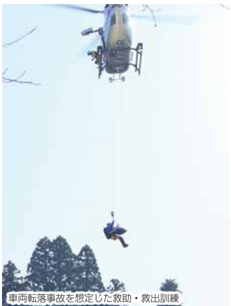
車両転落事故を想定した救助・救出訓練