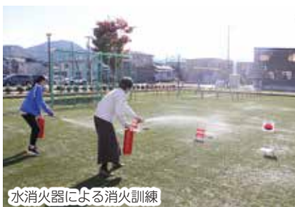
水消火器による消火訓練