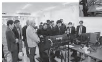
サンロードのeスポーツ拠点を視察