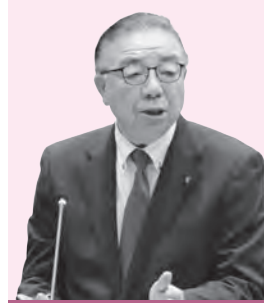
たか はし はじめ 高橋 肇 議員

当たり、学校現場や教職員等への負担増加が課題や問題化しているようだが、対応について伺う。 [答弁] 学校、行政、保護者、それから関係機関が連携して対応に当たる必要がある、今後も引き続きお願いしていく。