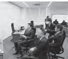
まったく触れたことのない議員も多い