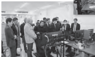
サンロードのeスポーツ拠点を視察