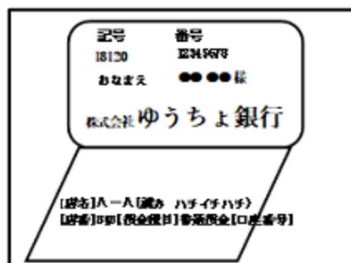
ゆうちょ銀行の場合

※ゆうちょ銀行の場合は表紙ウラの通帳見開き ページ全面のコピーを添付してください。