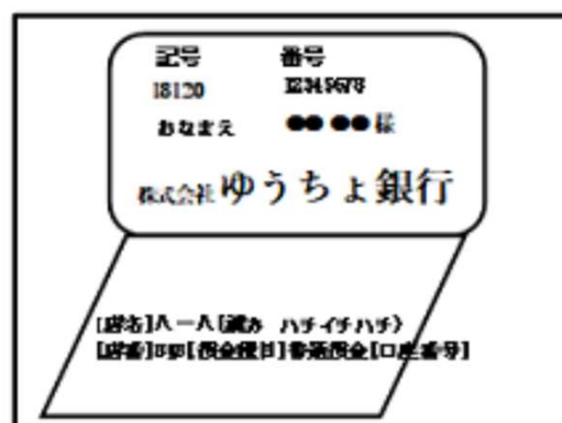
ゆうちょ銀行の場合

※ゆうちょ銀行の場合は表紙ウラの通帳見開き ページ全面のコピーを添付してください。