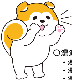
秋田労働局職業安定部 公式キャラクター 「ハローわんくん」