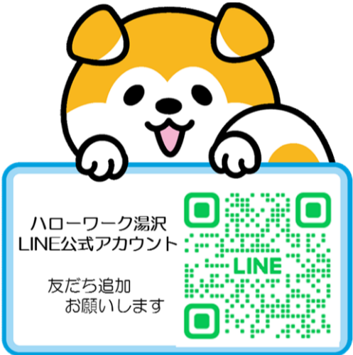
秋田労働局職業安定部 公式キャラクター 「ハローわんくん」