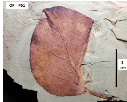
【サンズガワドロノキの葉の化石】