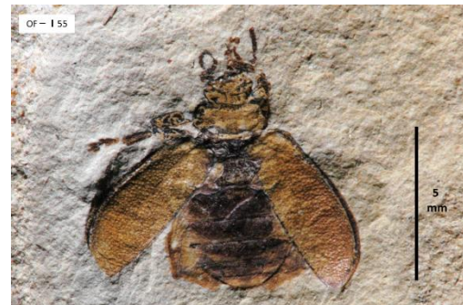
【ミヤマヒラタハムシの化石】