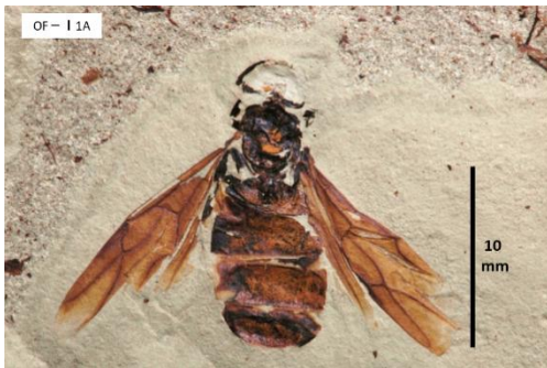
【有翅女王アリの化石】