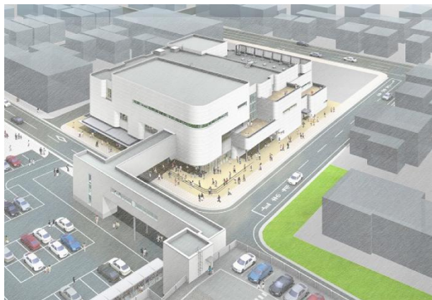
完成予想パース図

また、Yuinas（ゆいなす）との相乗効果が期待できる民間収益施設の誘致を進めてきましたが、Yuinas（ゆいなす）1階のカフェに大手コーヒーチェーンである「株式会社ドトールコーヒー」の出店が決定しました。国内トップクラスのシェアを誇るドトールコーヒーの出店により、Yuinas（ゆいなす）を利用する皆様の利便性や滞在性の向上などが期待できます。