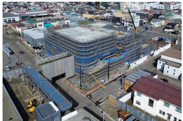
建設工事の状況（令和8年3月現在）