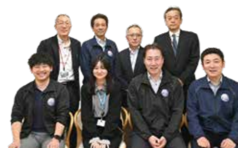
社会教育班の皆さん