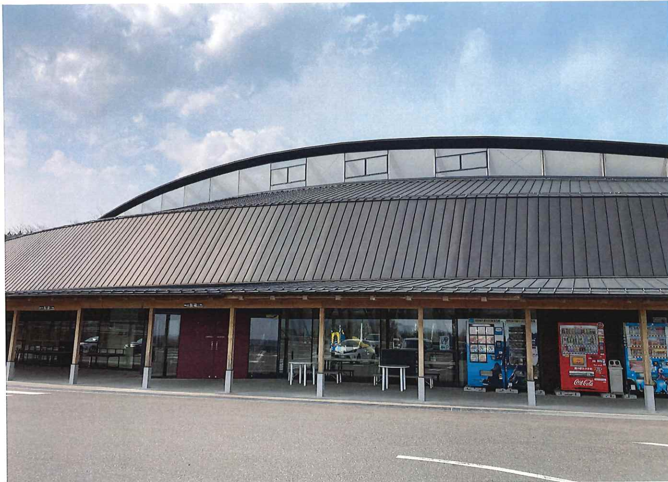
この日は「思惟の風」