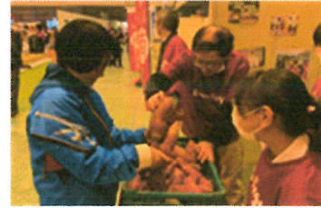
昨年、種苗交換会に参加