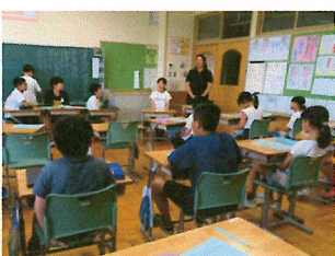
昨年の地区子ども会での話し合い