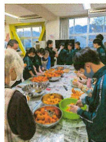
昨年の、柿の皮むき作業