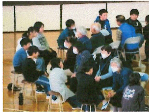
昨年のトークフォークダンス