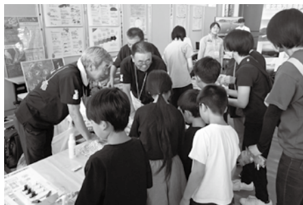
昨年の「まるごと体験！あきたのジオパーク」の様子