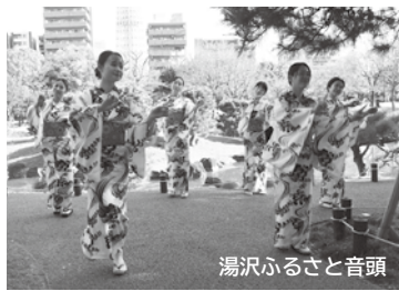
湯沢ふるさと音頭

「お稽古に余念がありません。ご存知のように、歌詞そのものが湯沢の名所や特産物などでいっぱい、の楽しい歌詞に生徒さんもすでに何名か友だち同士で湯沢を楽しんで下さっているようで心から感謝ですね。全国には楽し