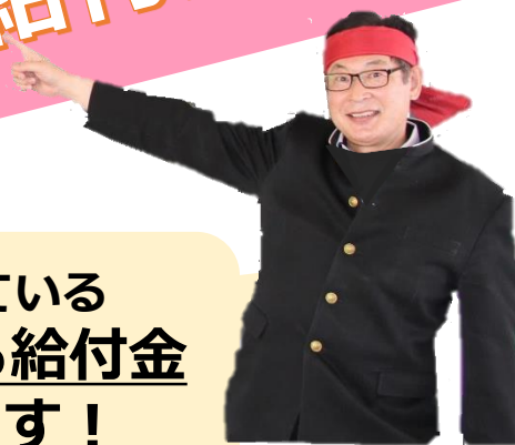
子育て応援団長 (湯沢市長)