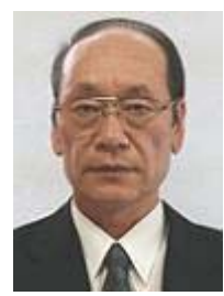
教育長 芳賀 誠