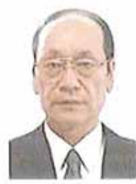
教育長 芳賀 誠