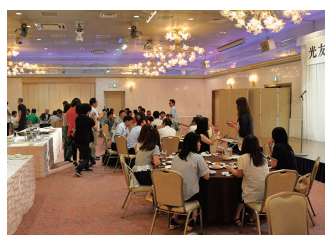
社内行事 (生ビール大会)