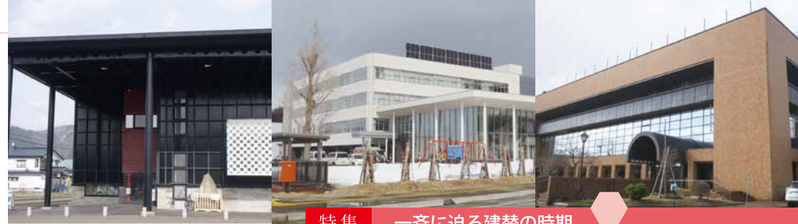
特集 一斉に迫る建替の時期