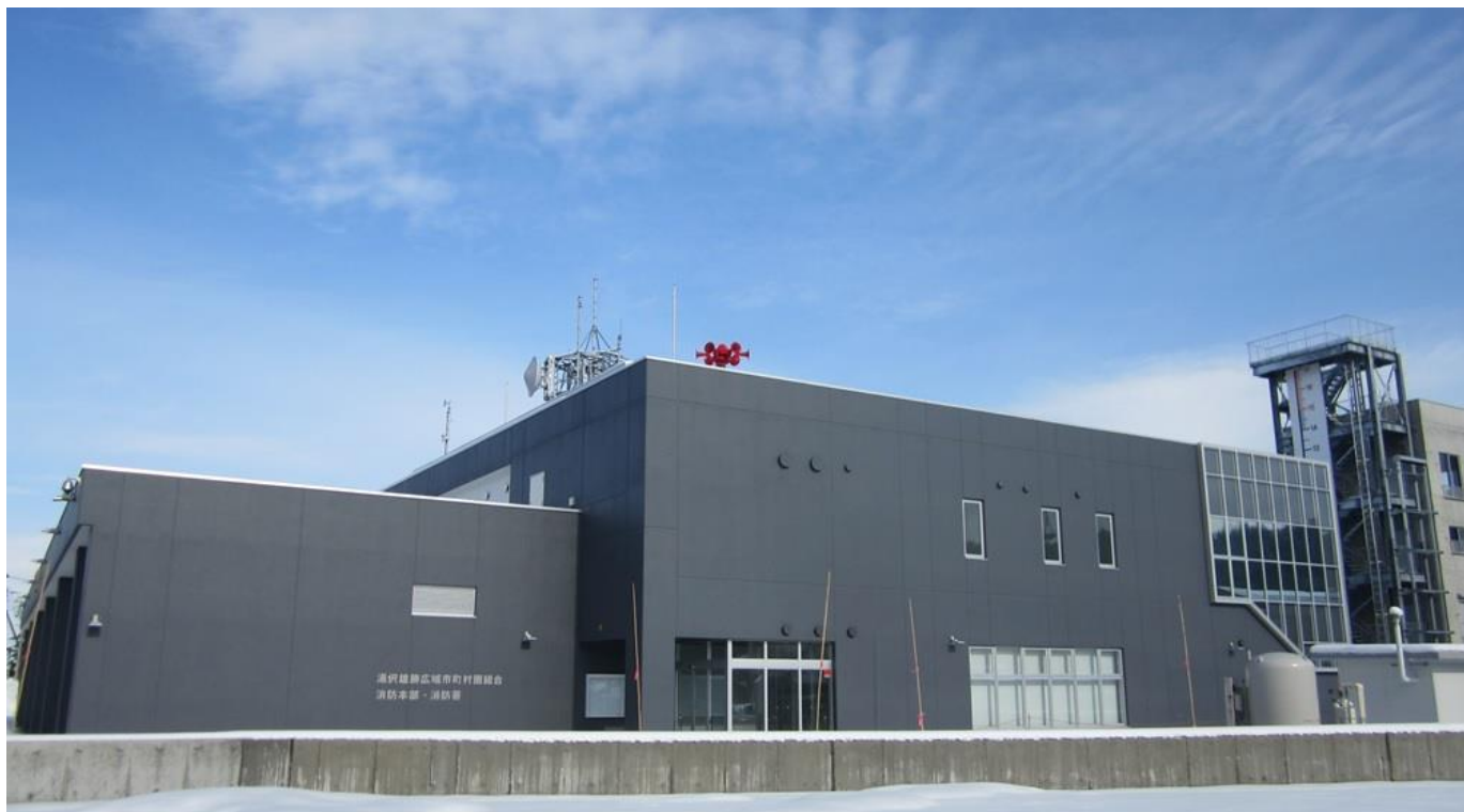
湯沢雄勝広域市町村圏組合 新消防庁舎