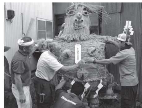
小野・御返事地区のわら人形と祭りの準備風景

ジオパークは「ジオ(地球)に親しみ、ジオを学ぶ旅、ジオツーリズムを楽しむ場所」と説明されることがあります。「旅」「ジオツーリズム」という言葉からは、なんとなく「市外からやってくるお客さん」に関係することなのだ、という印象を受けるかもしれません。