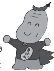
湯沢市介護予防キャラクター まめつち