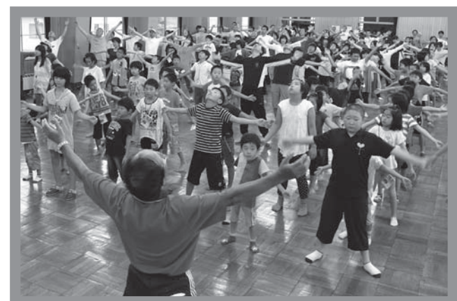
▲のびのびとラジオ体操を行う参加者たち

あいにくの雨で室内に会場が変更されましたが、参加者たちは、朝早くから元気にラジオ体操を行い、「来年は晴空の下でラジオ体操をしたい」と話している姿も見られました。