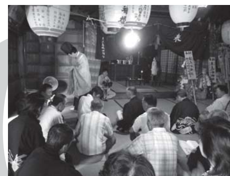
7月2日に東鳥海神社で行われた祈禱の様子