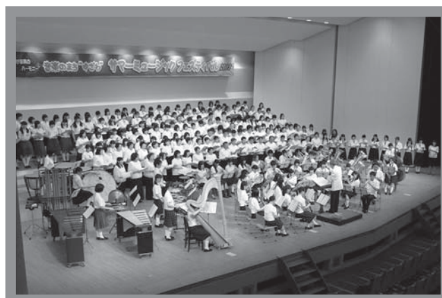
▲中学生・高校生・一般合同の合唱・吹奏楽団が18日の最後を飾る

両日合わせて約1,200人が来場し、子どもたちの演奏や大学生によるクラシックの名曲集の演奏を楽しみました。