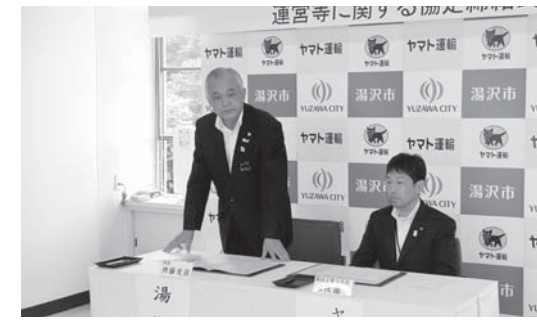
▲「災害時における緊急物資輸送及び緊急物資拠点の運営等に関する協定」締結式