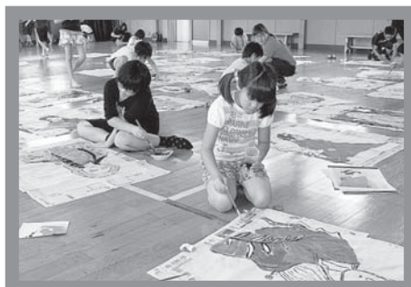
▲真剣な表情で色付けをしていました

7月24・25日、須川地区センターで須川・三関・山田小学校児童を対象に絵どうろう教室が行われました。