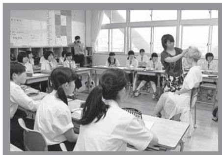
▲真剣な表情で話に聞き入る

7月17日、自分の生き方や将来の自分像を描く手助けにと、さまざまな職種の15人の講師を招いて行われた湯沢南中学校の「未来発見塾」。