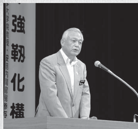
▲7月15日、東北中央自動車道新庄湯沢間早期実現フォーラムにて

地方の再生が大切であり、地域活性化統合本部を組織し、頑張る地方を応援したいとの故郷に対する熱い思いには、いつも感銘させられます。ますますのご活躍と私ども故郷の事業にも引き続きお力添えをお願いいたします。暑さ厳しき折、厳冬を乗り越えた力でこの夏を乗り越えましょう。暑さ寒さも彼岸までです。