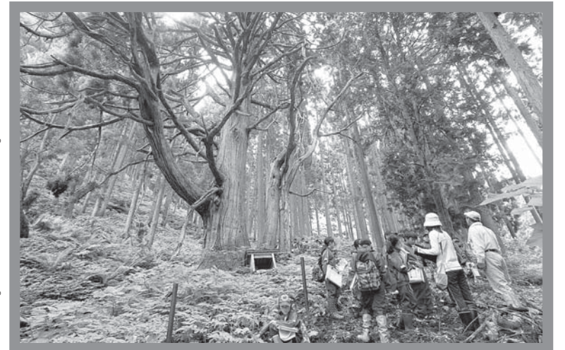
▲人工林の中で圧倒的な迫力を持つ「阿黒王の大杉」

子どもたちは、巨木を見上げながら直接触って感触を確かめたり、数人で手をつないで幹回りを測ったりして、自然の力を体感していました。