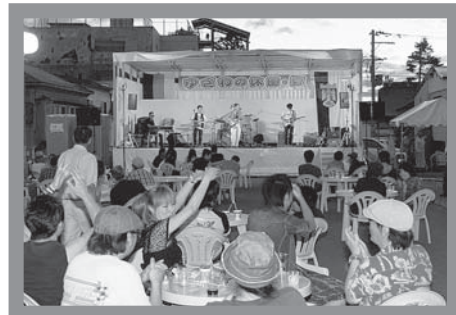
▲お酒やパフォーマンスに夢中になる来場者たち

会場には多種多様なお酒の他にも、東北各地のご当地グルメの屋台やちびっこ縁日などが並び、多くの来場者でにぎわいました。