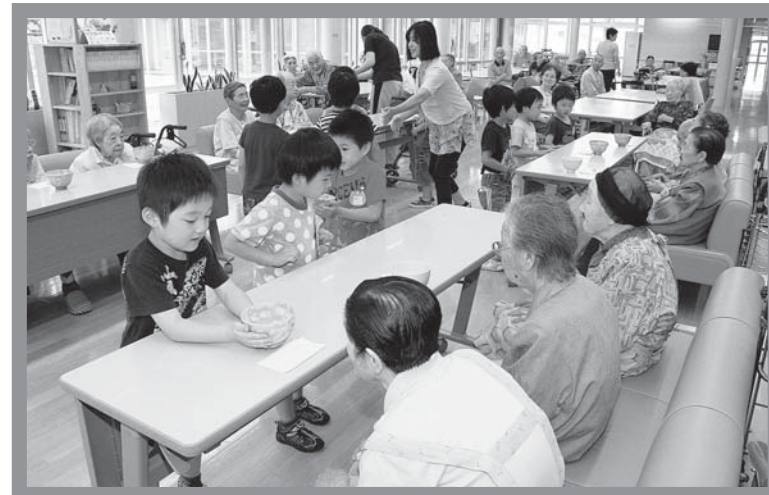
▲入所者は園児が届けるお茶とお菓子をうれしそうに味わっていました

完成した絵どうろうは、28日まで駅前通り商店街のチャレンジショップ2号館で展示されます。