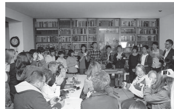
【ガーデンパーティー】