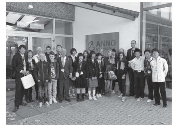
【体験通学先アンノギムナジウム】