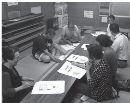
▲6月28日、桂川町内会（院内地区）

難協定を結ぼうとしている地域もあります。これは、平常時には施設と地域の合同避難訓練を行い、万が一の災害時には住民を受け入れ、そして施設入所中の人が、避難しなければならぬ時は、住民が駆けつけて避難の手伝いをするという内容です。