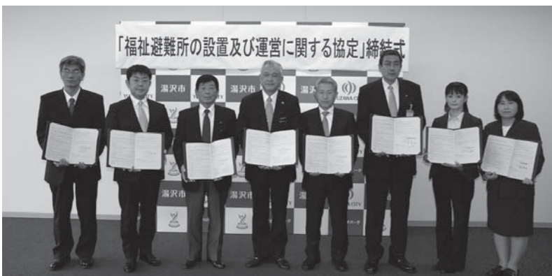
▲平成27年3月25日、市内8福祉・医療法人と「福祉避難所の設置及び運営に関する協定」合同締結式（1団体欠席）が行われました