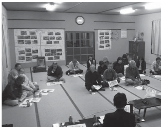
▲11月5日、外堀部落会（山田地区）