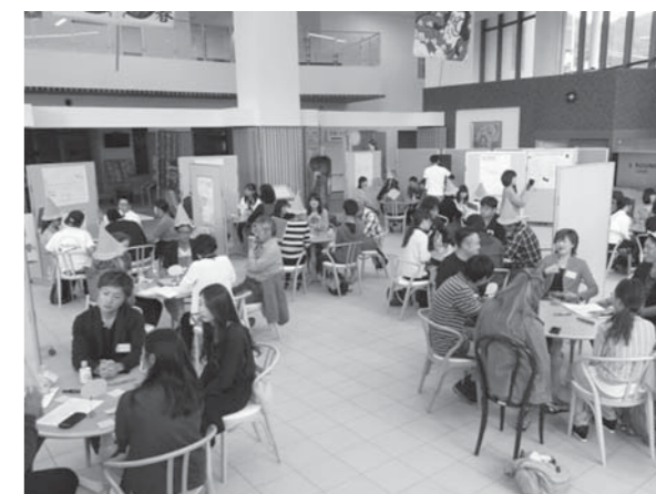
ワークショップ形式での会議の様子

今後は、ワークショップで出された意見を参考に、年度内に条例案を策定する予定です。