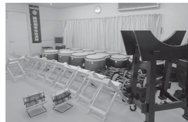
▲整備された和太鼓など