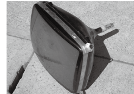
▲ テレビ (稲川地域)