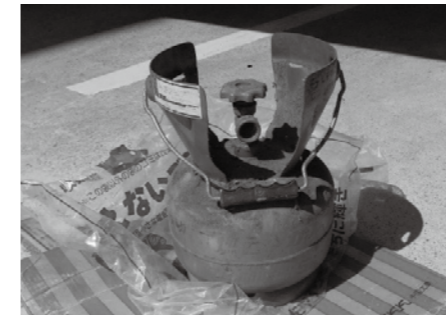
▲ ガスボンベ (湯沢地域)

●ビン・缶・ペットボトルなどの資源物にも、タバコなどの異物が混入していることがあります。出すときは、必ず中身を取り出し、きれいにしてください。 ●Tシャツや毛布などの古布は、再使用するための回収です。汚れ・破れ・カビなどがあるものは回収できませんので、燃えるごみとして出してください。 ●側溝へのポイ捨てや山林への不法投棄など、みだりにごみを捨てることは法律で禁止されています。自ら捨てないことももちろん、見回りや清掃活動など、ごみを捨てるににくい環境づくりにご協力ください。