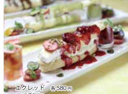
エクレット 各580円 ・ラスベリ ・ピスタチオ ・ティラミス

イタリアのアイスクーキ「セミフレッド」と地元香味野菜の特製カスタードクリームをエクレーアでサンド。温かいソースと冷たいセミフレッドとのコントラストが絶妙です。