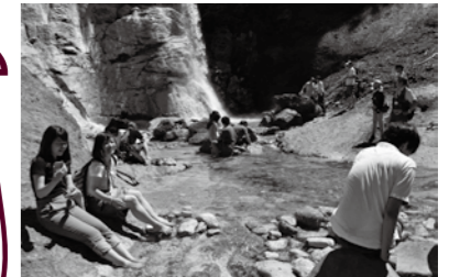
昨年のジオパークカレッジの様子