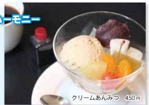
クリームあんみつ 450円

伊豆諸島神津島産の天草、十勝産小豆の自家製餡など、国内産原料を使用した、こだわりのあんみつに醤油あيسをのせた「クリームあんみつ」です。