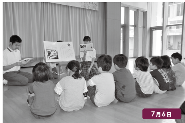
▲真剣に聞き入る皆瀬小学校1年生の児童たち