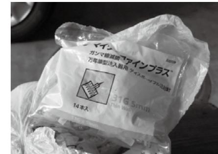
▲ 注射針 (地域不明)