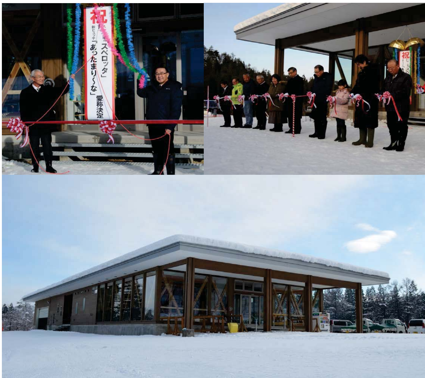
平成30年12月21日、稲川スキー場安全祈願祭・新ヒュッテ竣工式 愛称：稲川スキー場「スベロッタ」、新ヒュッテ「あったまり〜な」