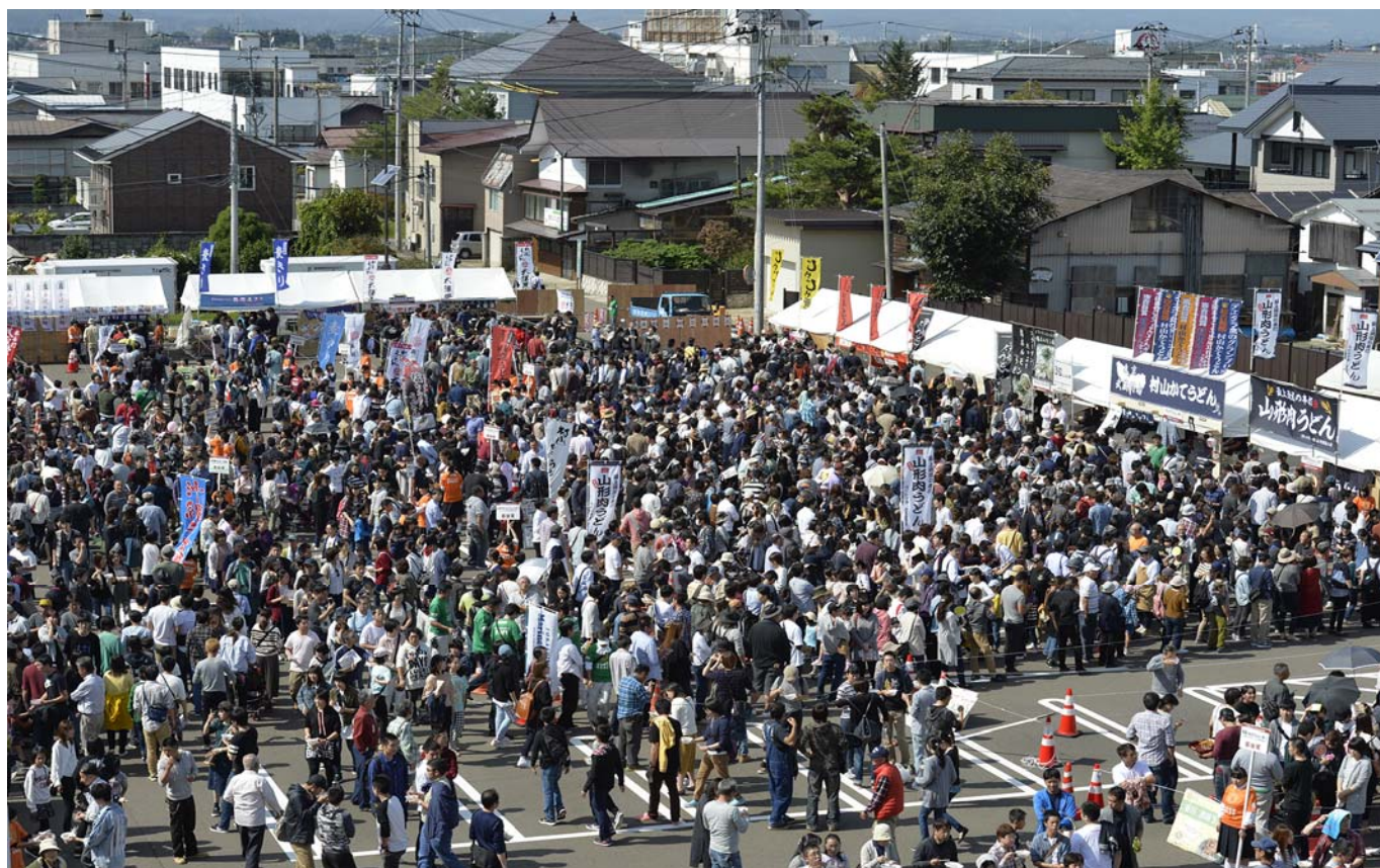
2017全国まるごとうどんエキスポ