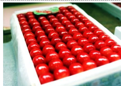
品質日本一の三関さくらんぼ