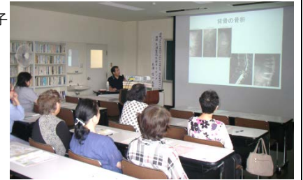
健診後の指導の様子