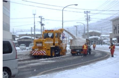
除排雪作業の様子