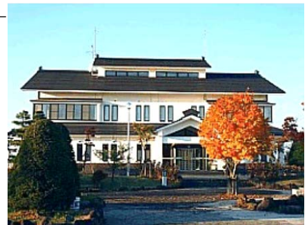
湯沢浄化センター

「問 16 防災・環境・都市基盤」分野のうち、今後さらに力を入れてほしい施策を2つ選び、施策番号を記入してください。