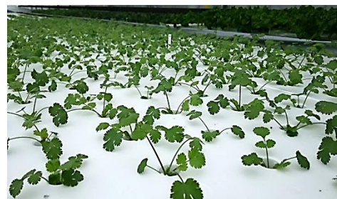
地熱活用水耕ハウスでのパクチー栽培