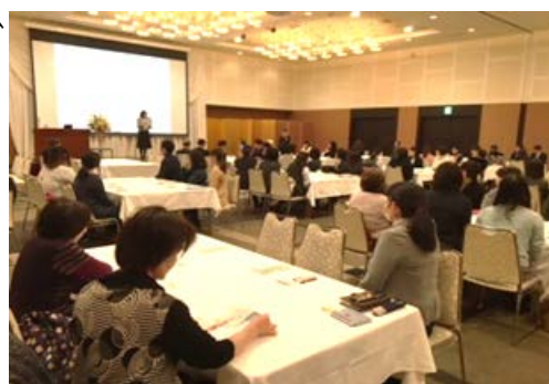
女性活躍推進フォーラム 「キラリ☆フォーラム」