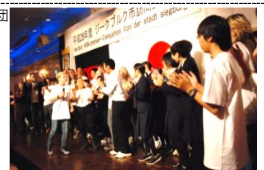
ジークブルク市からの訪問団との交流会