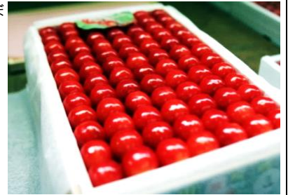
品質日本一の三関さくらんぼ