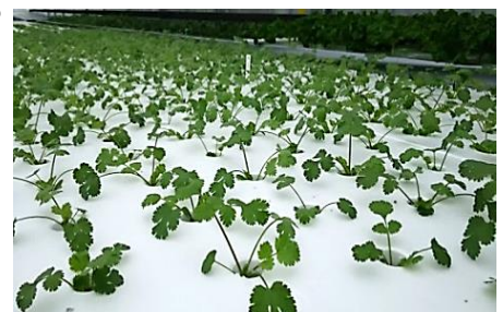
地熱活用水耕ハウスでの パクチー栽培