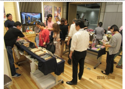
東京都庁での物産展