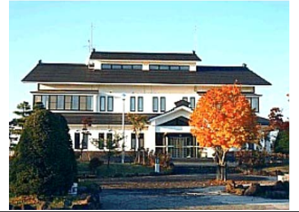
湯沢浄化センター