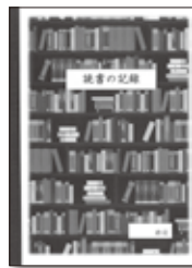
▲大人の方はこちらの記入式をご利用ください

市内図書施設（湯沢図書館・雄勝図書館・稲川カルチャーセンター・皆瀬生涯学習センター）に利用者登録している12歳以下のお子さんと、ご希望の方に「湯沢市 読書の記録」を交付しています。4月から対象を18歳まで拡大しますのでご希望される方は、各図書施設へお申込みください。