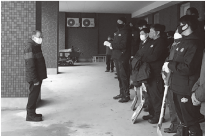
▲危険箇所パトロール出発式にて秋田ノーザンハピネッツ選手・チームスタッフへ激励