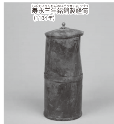
じゆえいさんねんめいどうせいほつづつ 寿永三年銘銅製経筒 (1184年)