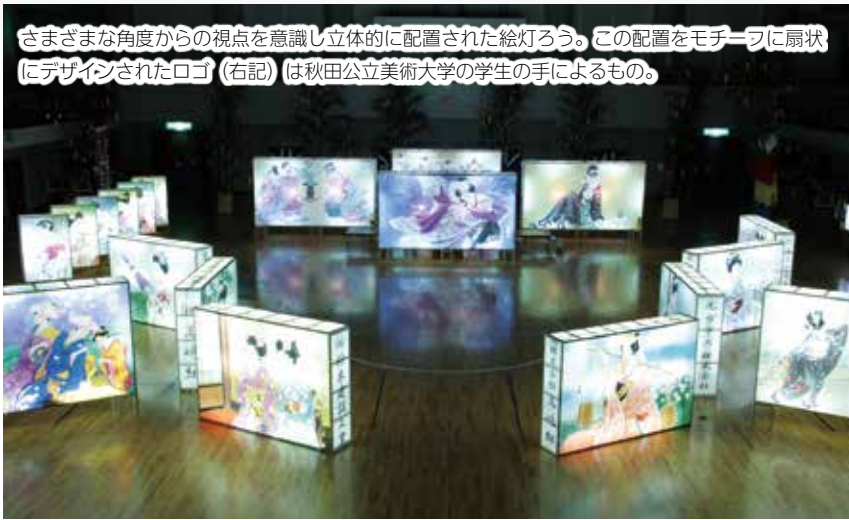
さまざまな角度からの視点を意識し立体的に配置された絵灯ろう。この配置をモチーフに扇状にデザインされたロゴ（右記）は秋田公立美術大学の学生の手によるもの。