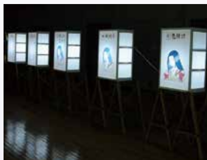
公立美大の学生のアイデアで、絵灯ろうの製作工程をイラストで段階的に描いたミニ灯ろうを展示。