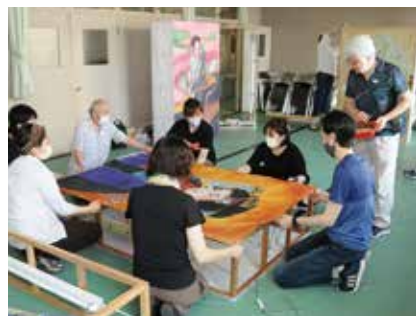
「絵どうろう講習会」で制作された絵灯ろうの貼 り付け作業。今年は湯沢商工会議所に展示され ました。こうした準備も祭りの一部です。

した」と振り返ります。 ロ「のデザインや、絵灯ろうの製作 工程を描いたミニ灯ろうの展示は学生 たちの提案によるもの。「絵灯ろうの 制作工程を見て、高い技術と大変さが 分かり、その工程を伝えることも祭り の役目だと思いました」と話す学生た ちからは、地元住民と同様の熱い思い が感じられました。 若者の視点で情報発信を 絵灯ろうをさらに「映える」映像に するため、イベント期間中は「佐藤礼 法きもの教室」の協力のもと、浴衣姿 のモデルを手配。また、毎年実行委員 会に参加している秋田大学教育文化学 部 地域社会コース 地域連携セミ・湯 沢市観光物産協会班の学生たちもモデ ルを務めました。 学生たちは「これまでの活動を通じ て、伝統や文化は地域の方たちにとっ