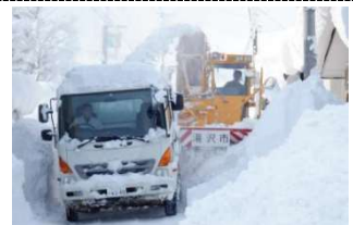
除排雪作業の様子