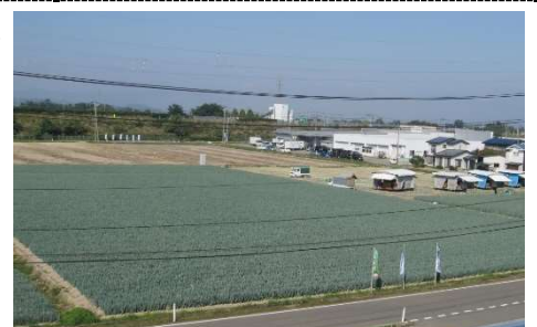
ネギの園芸メガ団地