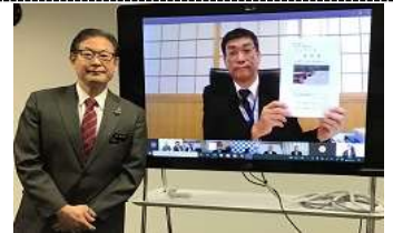
道路整備促進の要望活動