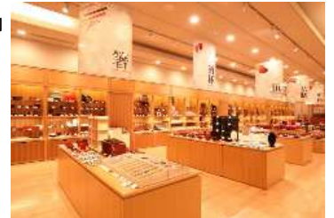
川連漆器伝統工芸館の館内