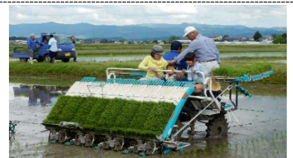
田植え・山菜摘みツアー