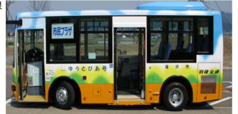
雄湯郷ランド循環線