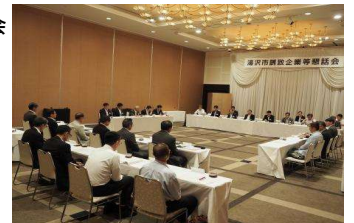
誘致企業等懇話会