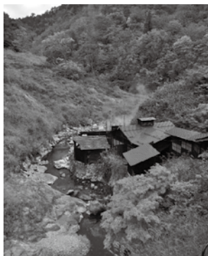
◀ゆざわジオパーク市民応援隊かたり隊の阿部旅館（大湯温泉）

カジカガエルが、その代表格。川に生息する一般的なカエルですが、高い水温でも生きることができ、源泉近くでは温泉藻を求めてオタマジャクシが密集します。「清流の歌姫」と評されるほど美しい鳴き声のカエルですので、出没するスポットを訪れた際にはぜひ耳をすませてくださいね。