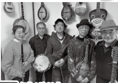
1部 午後1時30分～ オールドアンド・ニュー 癒し系アマチュアバンドOld & New

1部は、癒し系アマチュアバンド オールドアンド・ニュー Old & Newの皆さんによる演奏をお届けします。アイリッシュ音楽のどこか懐かしく優しい響きに癒されてはいかがでしょうか。