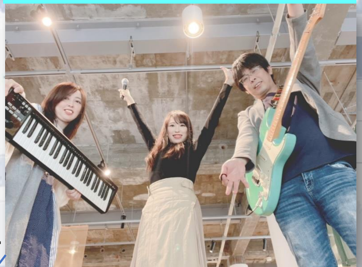
UNLIMITED COLOR アンリミテッドカラー