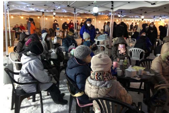
【いんない咲良フェスタ2022】