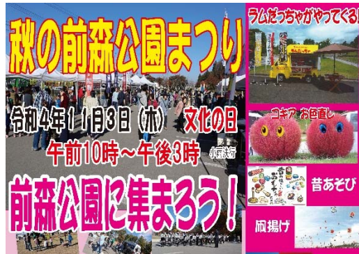
【前森公園まつり（前森公園愛護会）】