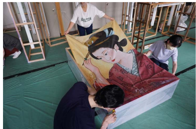
▲貼付け作業 ※期間終了後、別途作業日を設けて行います