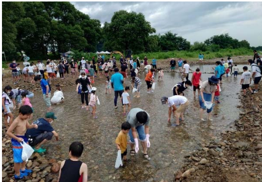
【チビっ子アユつかみ大会】