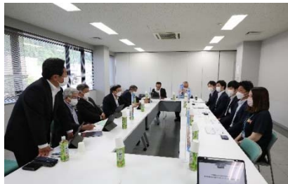
R4.6.16 北都銀行湯沢支店「明日の湯沢を考える会」の皆さんと