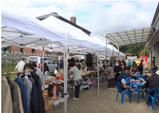
【フリーマーケット（おがちふるさと学校）】