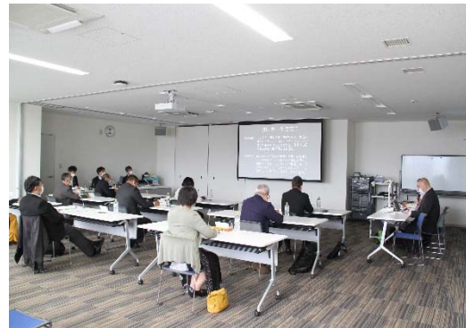
【令和4年度公開プレゼンテーション】