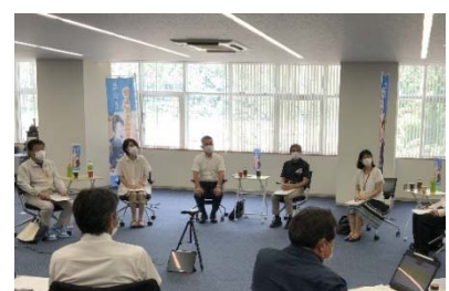
R4.7.20 部活動指導者の皆さんと