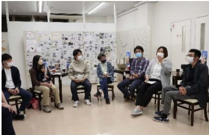
R4.5.31 湯沢市に移住された皆さんと