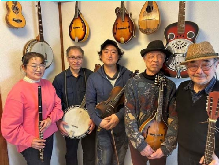
癒し系アマチュアバンド Old & New