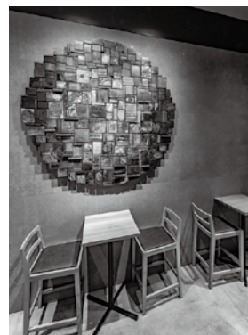
ウッドデザイン賞2019受賞

問 港区との協定に関すること(農林課林務班 ☎55-8569) ゼロカーボンに関すること(環境共生課環境対策班 ☎55-8069)